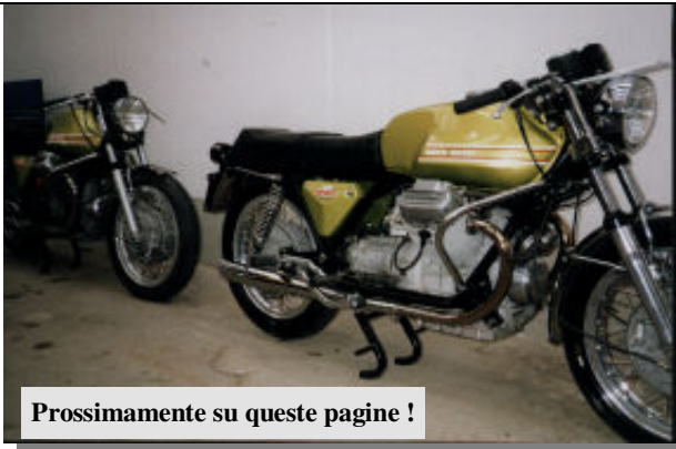
Prossimamente su queste pagine !

Domenica 14 Maggio Si va al mare (Rimini) Un pranzo in compagnia con le V7 E' necessario telefonare per dare l'adesione entro Mercoledì 10 Ai numeri: 0541-679305 delle 20.00 alle 20:30 (Giancarlo- Rimini) 0522-888442 (Stefano- Reggio E.)