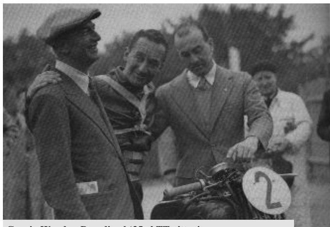
Guzzi- Woods e Parodi nel '35 al TT vittorioso

Tornando al nostro amico Sardo gli vorrei passare un'informazione: "sull'ultimo numero di Mostra Scambio c'è un tizio che vende telaio con numero di targa per V7 Special". Potrebbe fare al caso tuo, prova a sentire il telefono è : 0339-8710019 oppure 050- 32435. Con il telaio e la targa puoi richiedere l'estratto cronologico al PRA e con quello andare al collaudo, naturalmente dopo aver cambiato il telaio della tua sconosciuta V7. Buona Fortuna